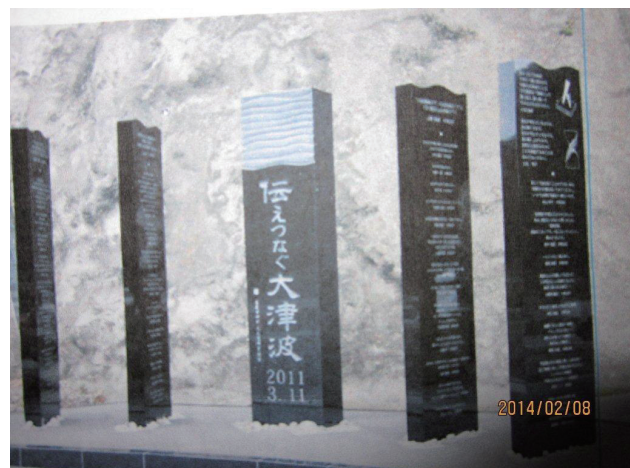
la monumentoj en Tooni

Mi vizitis la urbojn atakitajn de granda cunamo kaj malgajiĝis plurfoje vidante detruitajn digojn kontraŭ cunamoj kaj sendomajn kvartalojn. Sed fine mi havis la esperon al geknaboj de la elementa lernejo, kiuj diligente kantis tutkorpe.